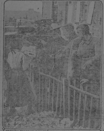
La interesante fotografía reproducida es tomada en una ciudad francesa durante un pequeño descanso durante el combate. Varios soldados ingleses compran dulces a una campesina francesa. El nombre de la ciudad ha sido suprimido por el censor