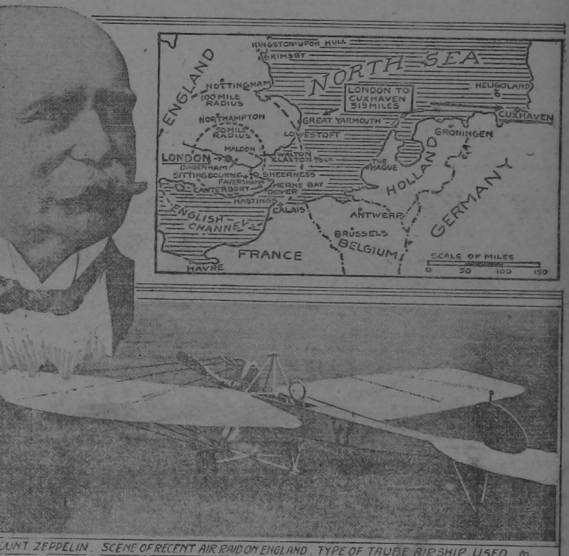
COUNT ZEPPELIN. SCENE OF RECENT AIR RAID ON ENGLAND. TYPE OF TAUBE RIGSHIP USED.

LONDRES, 5. —Telegramas de Holanda dan la noticia de que el Conde de Zeppelin está en Cuxhaven, dirigiendo personalmente las operaciones de la flota aérea. Se nota extraordinaria actividad en las bases de Emden y Cuxhaven. Mue tras los zeppelins que volaron sobre Inglaterra salieron de su base de Cuxhaven, el "taube" que voló sobre Kent salió de las líneas inglesas de Bélgica.